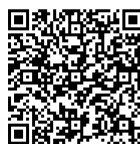
Galéria ďalších fotografií na www.automagazin.sk

ale konštrukcia podvozka a vysoké pneumatiky z vás urobia kráľa ciest. Ešte milším prevapením je jazda na diaľnici: vozidlo je pokojné, hlučné len primerane, na bočný vietor citlivé oveľa menej, než by ste očakávali a ani spotreba čosi nad 9 l/100 km pri 130 km/h nie je neprimeraná vzhľadom na jeho charakter. A ak si dáte záležať, aj v horských serpentínach dokázate vďaka potentnému